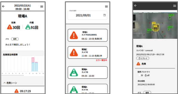
作業の記録・管理画面

専用のブラウザアプリを使い、現場ごとの危険シーン等をピンポイントで確認できます。シーンやその日の現場に対してメモをしたり、動画のダウンロードも行えます。