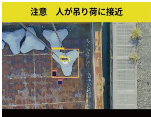
検出結果画面 (モニタでの表示イメージ)

モニタで表示される撮影画像には、AIで検出した作業員や吊り荷に対して検知枠を重ねて表示します。